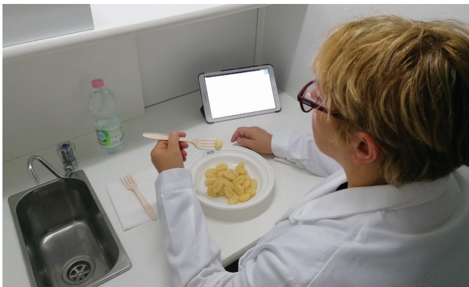
Uno dei giudici sensoriali di Adacta International durante l'analisi degli gnocchi

Ulteriori informazioni su: www.adactainternational.com