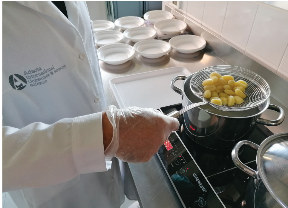
La preparazione degli gnocchi per l'analisi sensoriale in uno dei laboratori di Adacta international